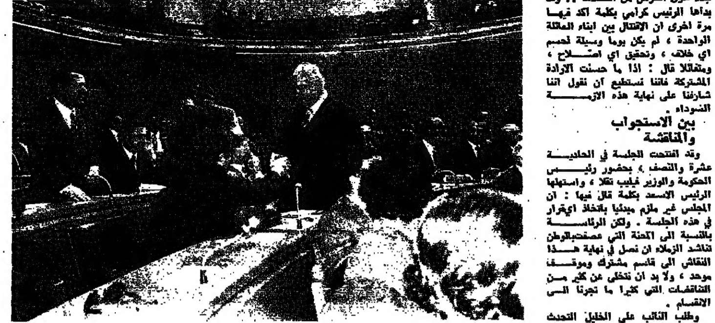
حور بين العميد اد والتين نصري الملقون ورقيب شادين

انتم على سبيل المثال، وعلينا ان نكون ونظنا واحدا سيدا، وبفرس الملقون - اسئلة